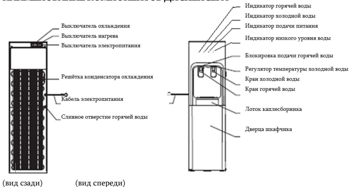
Рис.1 Наименование компонентов диспенсера