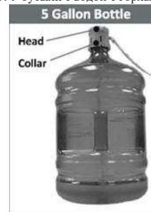
Рис.3 Установка водозаборника на бутылю с водой

3. У бутылки с водой с горлышка снимите гигиеническую пленку и крышку.